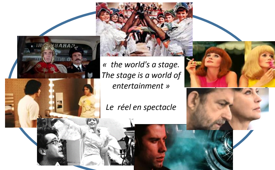
« the world's a stage. The stage is a world of entertainment »