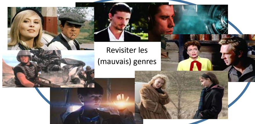
Revisiter les (mauvais) genres