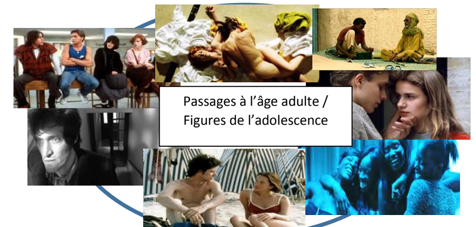
Passages à l'âge adulte / Figures de l'adolescence