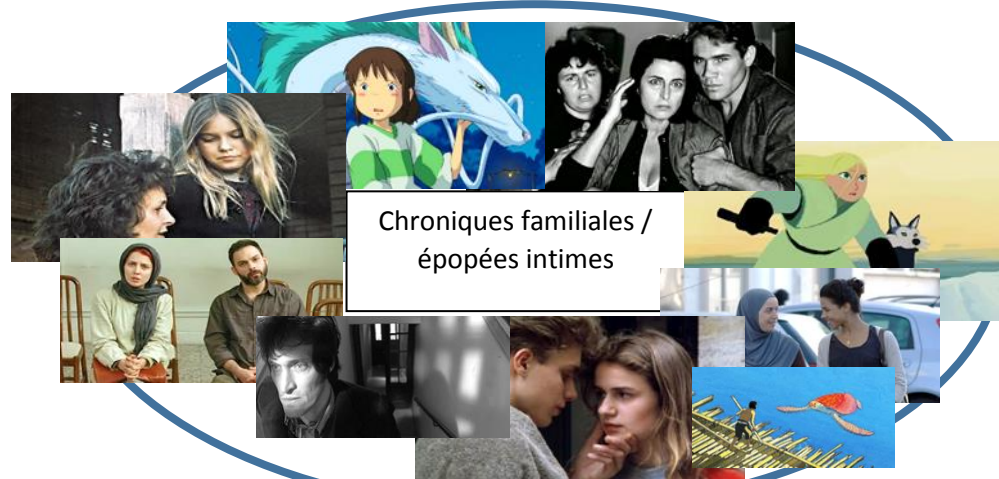
Chroniques familiales / épopées intimes