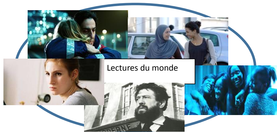
Lectures du monde