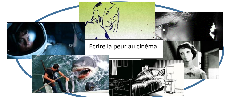
Ecrire la peur au cinéma