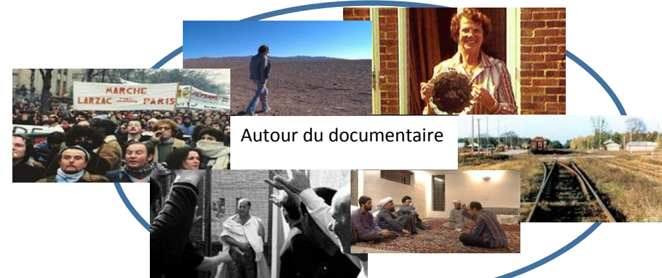
Autour du documentaire

Lycéens et Apprentis au cinéma Nouvelle-Aquitaine / Académie de Limoges Consultation programmation 2019/2020